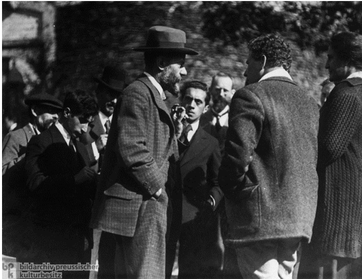
Max Weber 1917 ( '10005704-p)