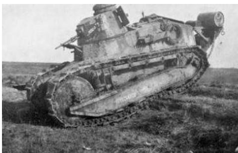
char Renault → .....