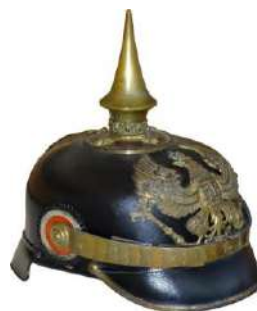
casque allemand → .....