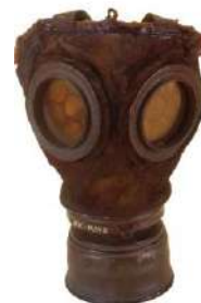
masque à gaz → .....