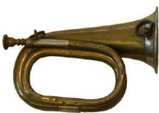
clairon → .....

A toi d'imaginer pour ces objets un mot qui pourrait désigner les objets suivants en s'inspirant de leur forme ou du bruit qu'ils font lorsqu'ils sont en action :