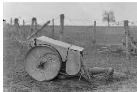
bouclier roulant → .....