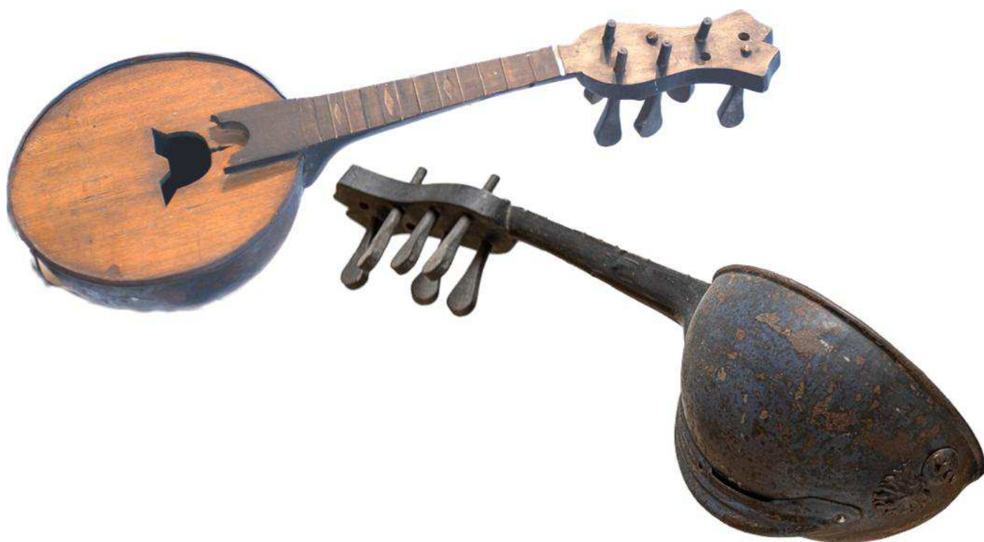
Vue de face / Vue arrière

Mandoline allemande (Anonyme)