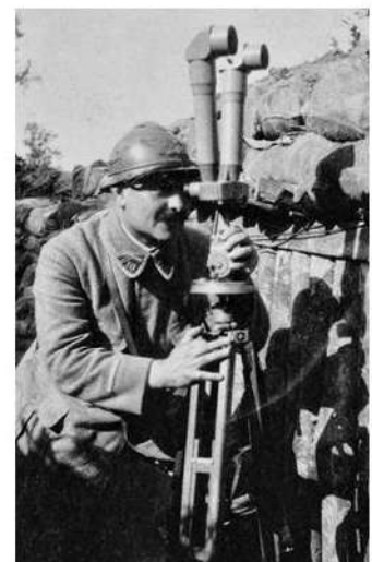
© Historial de la Grande Guerre