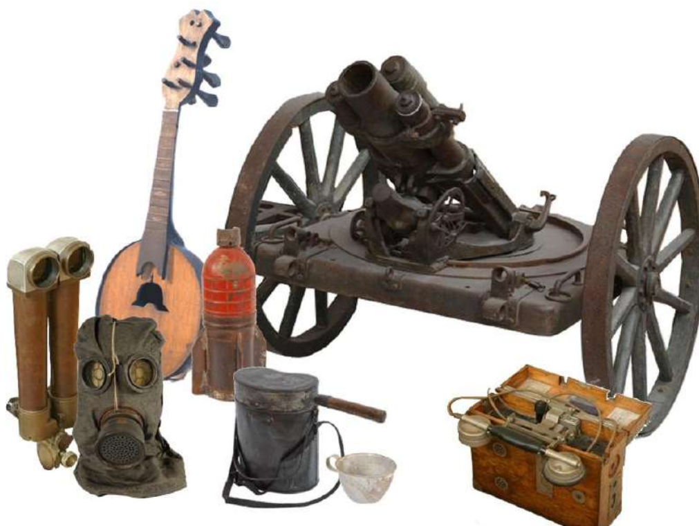
De gauche à droite :