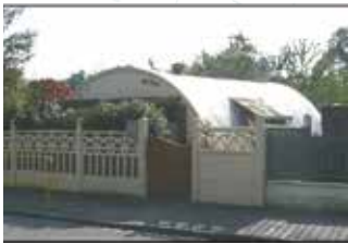
La dernière maison Nissen de Péronne

• Au lendemain de la guerre, cette rue était occupée par d'étranges maisons (il n'en reste aujourd'hui qu'une seule, près du lycée P. M. France). Retrouvez la photographie ancienne qui montre cette rue à l'époque de la reconstruction.