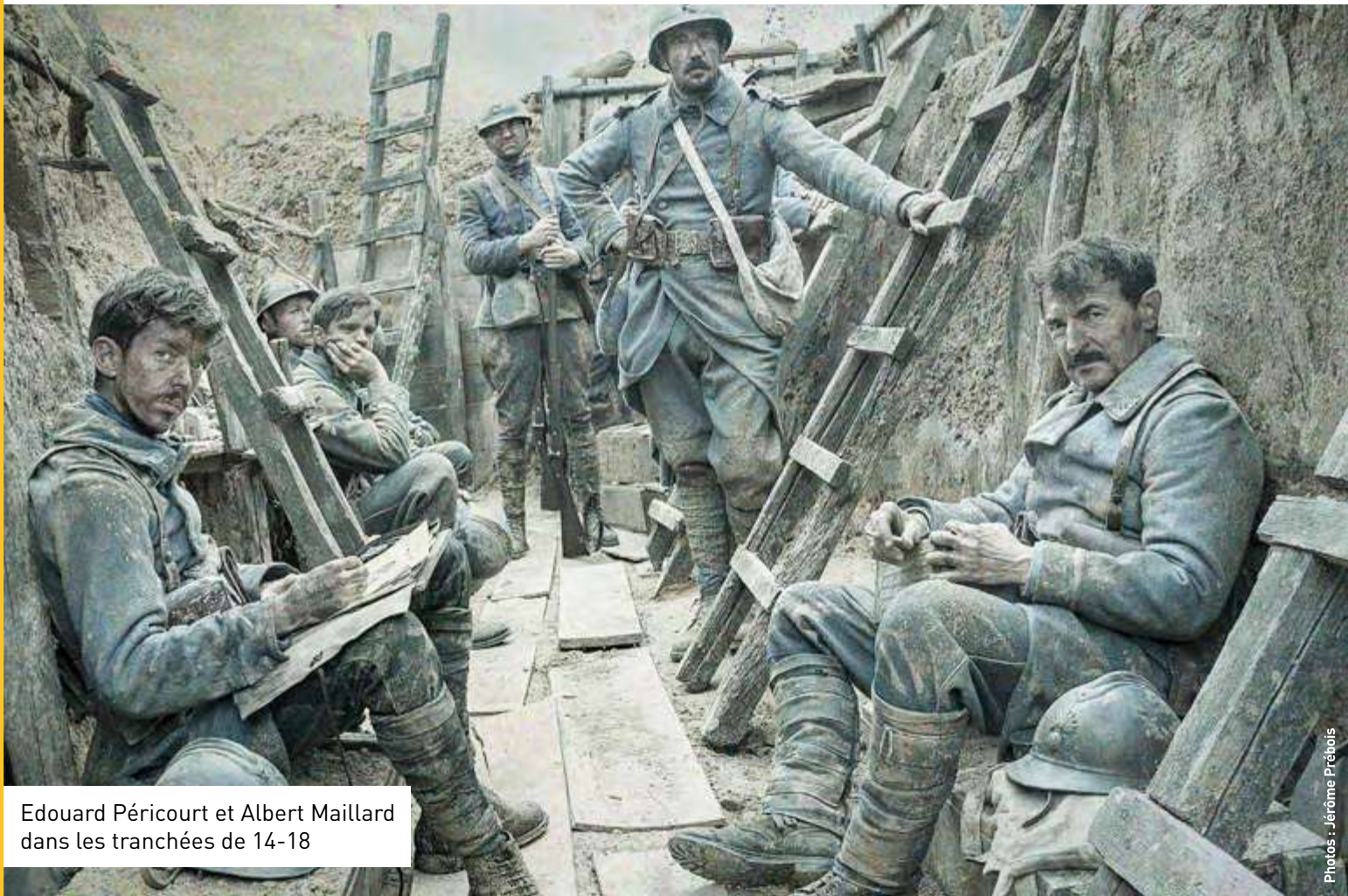
Edouard Péricourt et Albert Maillard dans les tranchées de 14-18