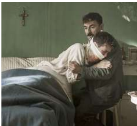
Document 1 : Douleur