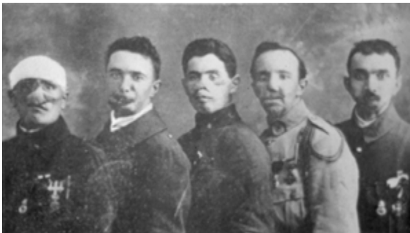
Document 4 : La Délégation des gueules cassées, témoin de la signature du Traité de Versailles, le 28 juin 1919