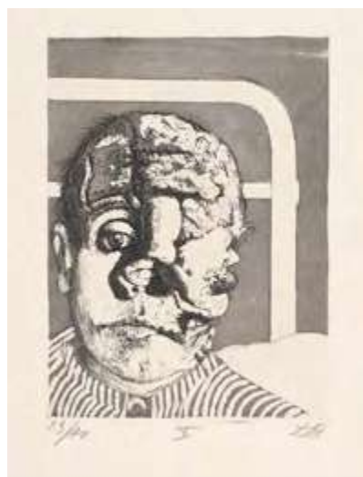
Document 2 : Otto Dix, Transplantation , 1924 Eau forte, Aquarelle et pointe sèche dans la série La Guerre , livre II, 19,5X21 cm